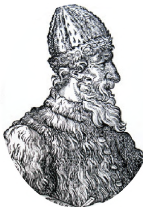
Великий князь Иван III

До XVIII века чиновники на Руси жили благодаря так называемым «кормлениям», то есть, при отсутствии оклада за исправление должности, разрешению на подношения от заинтересованных в их деятельности лиц. Одаривали их не только деньгами, но и «натурой» — мясом, рыбой, пирогами и пр., что было делом обыкновенным.