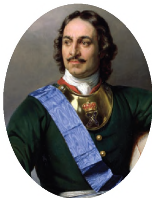
Император Петр I

Сообщениями «о похищении казны» первоначально занималась тайная канцелярия во главе с графом П.А. Толстым. И работала она на совесть. Но были и такие дворяне и чиновники, которые к проблеме мздоимства относились гораздо терпимее. По рассказам современников, однажды в Сенате Петр пригрозил издать указ, по которому всякий, кто украдет у казны сумму, на которую можно купить веревку, будет повешен. Генерал-прокурор Ягужинский на это заметил: «Неужели вы хотите остаться императором без служителей и подданных? Мы все ворует — с тем только различием, что один больше и приметнее, чем другой».