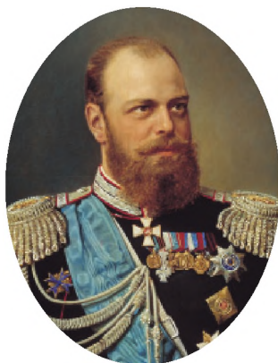
Император Александр III