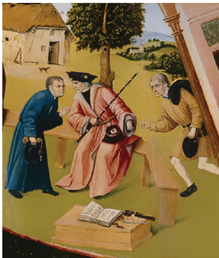
Фрагмент «Алчность» картины Иеронима Босха «Семь смертных грехов»

Рассматривая участников коррупции на примере взяточничества, стоит отметить, что в коррупционном процессе всегда участвуют две стороны. Одна сторона — это взяткополучатель (подкупаемый). Вторая сторона — это взяткодатель (осуществляющий подкуп). Также в процессе может участвовать и третья сторона — посредник.