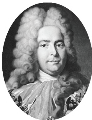
Генерал-прокурор Павел Иванович Ягужинский