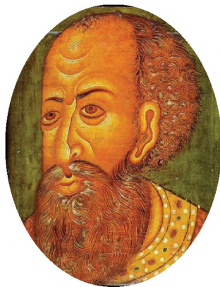
Царь Иван IV Грозный